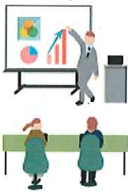
管理職対象ハラスメント研修

昨年度から新型コロナウイルスの影響により、開催延期や規模縮小、或いはリモートで開催してきた研修スタイルでしたが、対面開催が復活しつつある中、改めて研修の必要性、さらには対面によるコミュニケーションの大切さに気付くことができました。今後も、様々な感染対策や工夫等を講じながら、職員の知識や技術のレベルアップを図り、施設を利用される方々の笑顔や満足に少しでも結び付けていきたいと考えています。