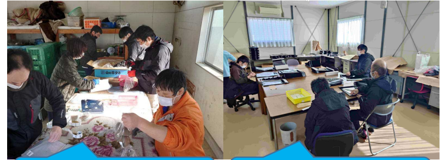
長芋の袋詰め作業