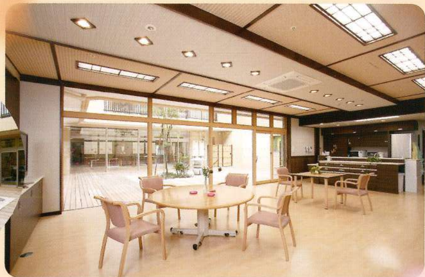
談話コーナー ユニット内共同生活室

食事をしたり、他のお客様と歓談したりと思いの時間を過ごして頂けます。ユニットは10人ずつで、1丁目と2丁目があり、それぞれ中庭を囲んだ形になっています。落ち着いた古民家風の色調と明るい白木調のユニットがあります。ユニットから出て家族の方と過ごして頂ける談話コーナーもあります。