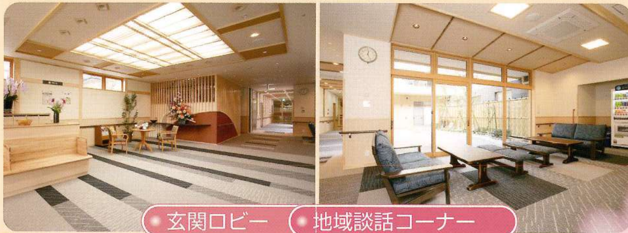
玄関ロビー 地域談話コーナー