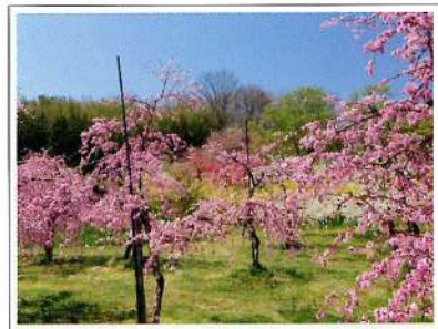
【飯坂温泉花ももの里】

世界中から集めた40品種を植栽、敷地80アールに花桃の本数約300本が咲き競います。毎年4月初めには、「飯坂温泉花ももの里まつり」に福島県内外から多くの方が訪れ、飯坂三味線や飯坂太鼓などの伝統音楽や、飯坂餃子などの食べ物の振る舞いなどが開催されます。 開花期は4月初旬から5月初旬で品種はバラエティーに富んでおり、代表的な品種は、矢口・寒白・菊桃・源平枝垂れ・照手水密・露桃。変わったものでは寿星桃・山桃（ロトウザクラ）・雲龍桃などがあります。